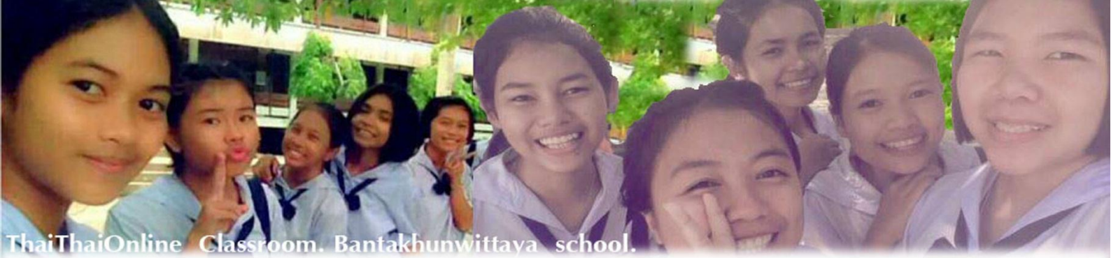
ThaiThaiOnline Classroom. Bantakhunwittaya school.